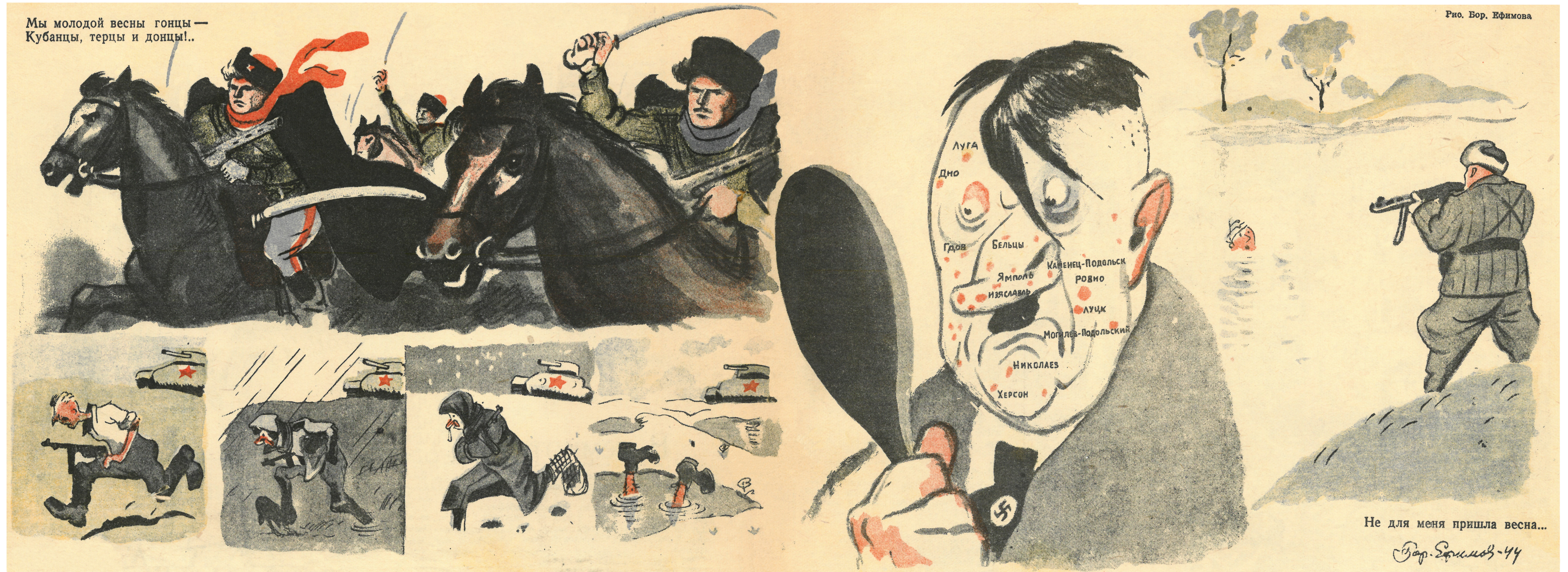
Весенние побеги во всех четырёх сезонах.