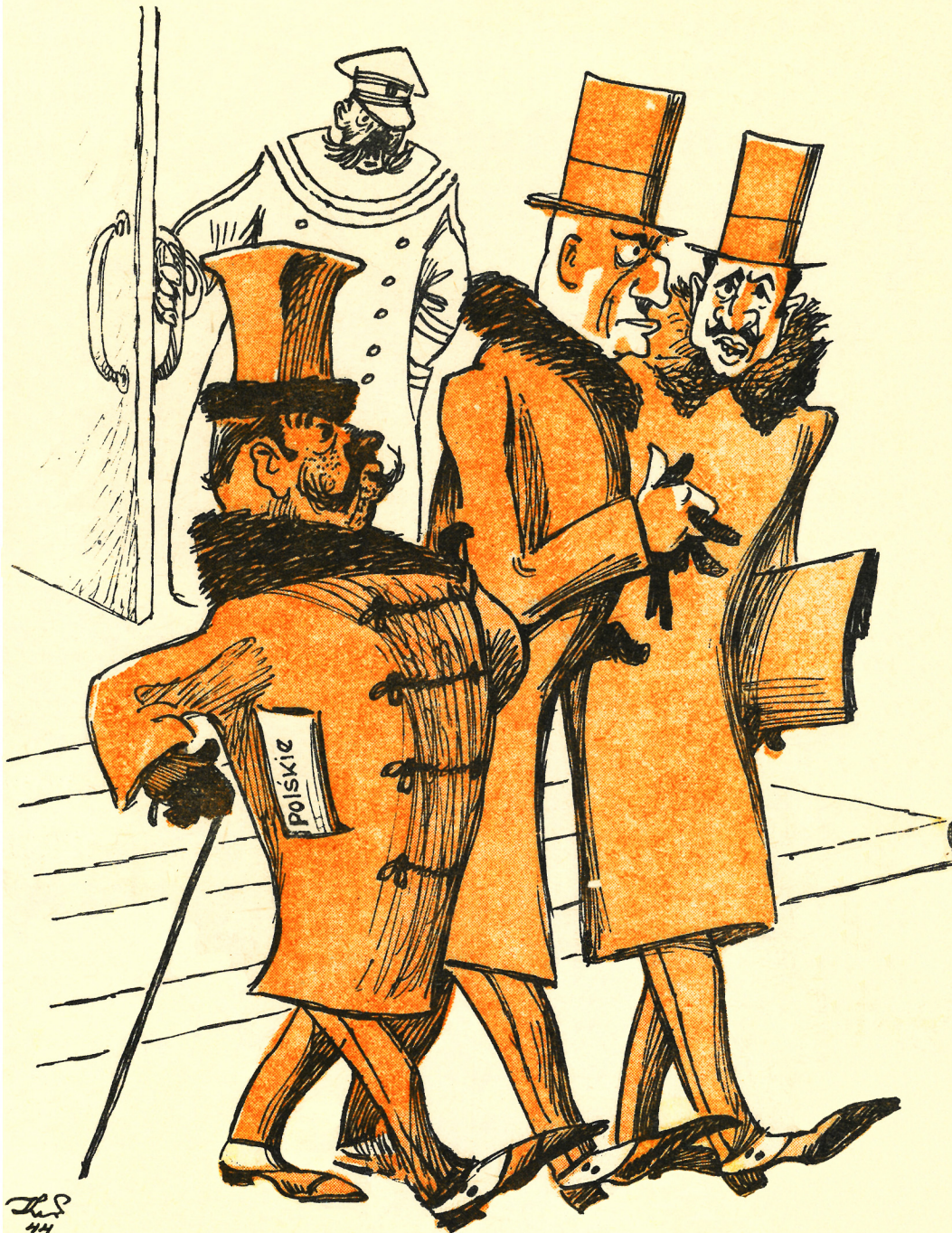
Рис. К. Елисеева

— Пора, наконец, уволить этого пьяницу-швейцара! — Что вы! Кого же мы тогда будем представлять?