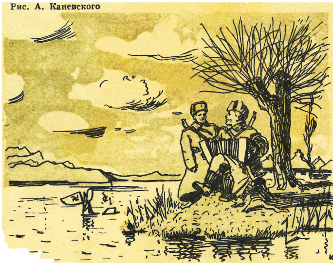
Рис. А. Каневского

— Что играешь, Петруха? — На берегу Прута — вальс «Дунайские волны».